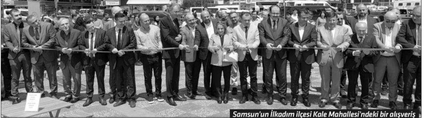
Samsun'un İlkadım ilçesi Kale Mahallesi'ndeki bir alışveriş merkezinin bahçesinde düzenlenen sergi ilgi gördü

Samsun T Tipi Kapalı ve Açık Ceza İnfaz Kurumunda "Bu ellere sanat yakışır" sloganıyla tutuklu ve hükümlülere yönelik açılan el sanatı kurslarının sergisi açıldı